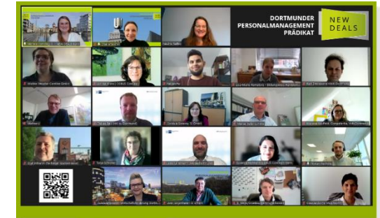
Ausbildung in schwierigen Zeiten NEW DEALS digital am 23.02.2022